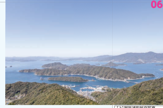
[A] 御所浦町航空写真 [B] 牧島から望む不知火海 [C] 島嶼からの眺望